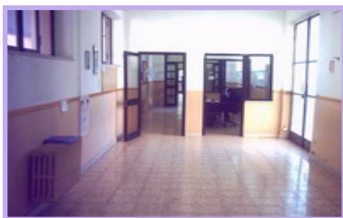
FIGURE DI RIFERIMENTO