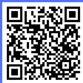
FIGURE DI RIFERIMENTO

Inquadrando il QR si apre la pagina del sito istituzionale dove sono pubblicati i progetti deliberati dal Collegio Docenti